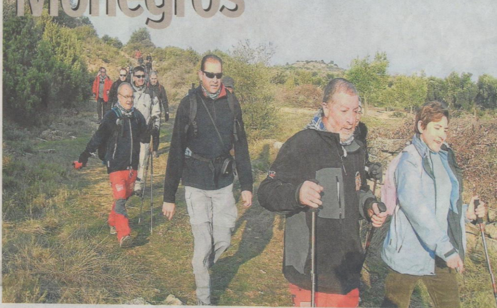
Senderistas en la última edición de la Ruta de los Monegros celebrada en 2011. OS ANDARINES D'ARAGÓN

El próximo día 4 de febrero comenzará la 7ª edición de la Liga de Senderismo Popular de Aragón. Este año, además, el número de andadas aumenta, respecto a las que se organizaron en 2011, lo que pone de manifiesto el auge del senderismo en esta Comunidad y, al mismo tiempo, demuestra que este deporte está al alcance de todos.