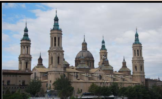
Plaza del Pilar (Zaragoza)