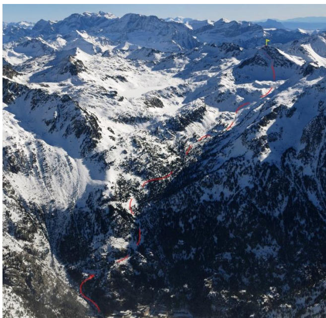
Ruta de ascenso al Pico de Tablato que seguiremos hasta la cota 2200.

Se sale del Balneario de Panticosa (1636 m) siguiendo la GR-11 hacia Brazatos. En una de las curvas del sendero nos desviamos a la derecha para ir al valle de Brazato. Se progresa por el bosque por unas palas inclinadas. Hacia la cota 2.000m el valle se suaviza y buscaremos cruzar el barranco de Brazato. Seguiremos hacia el fondo de valle. En el circo, rodeados de los picos Tablato, Piniecho y Brazatos, alrededor de la cota 2200 comenzaremos la bajada, buscando un paso hacia los ibones de Brazato, para luego seguir descendiendo por la GR 11 y volver al Balneario.