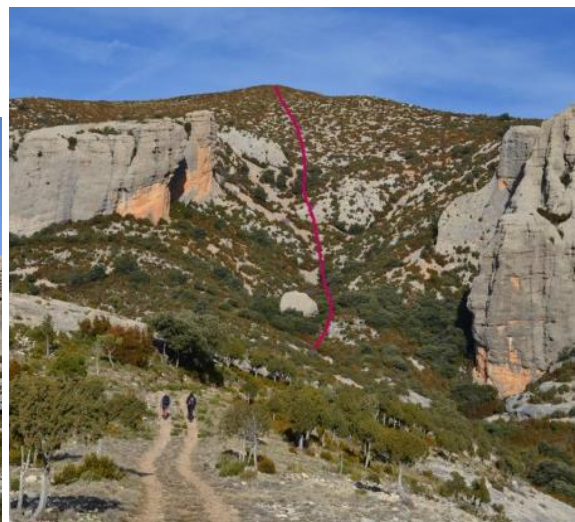
Subida al Mondinero