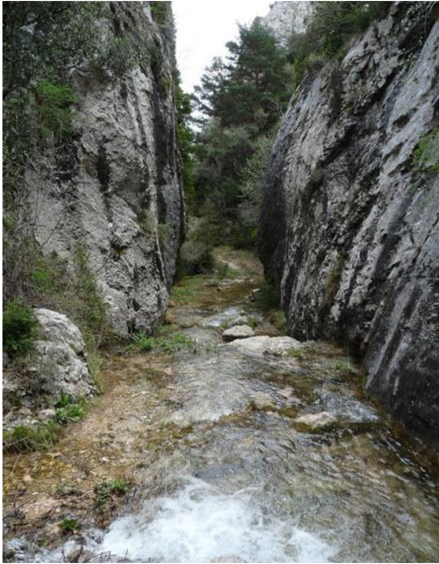
Garganta de Fabana