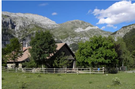
Refugio de Gabardito