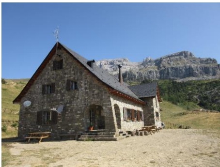
Refugio de Lizara

NOTA: depende como se desarrolle la marcha y la dinámica del grupo, se podría proponer subir al pico Bisaurin (2670 m) desde el collado de Lo Foratón (unas 3 horas más de actividad y 700 metros de desnivel acumulado mas)