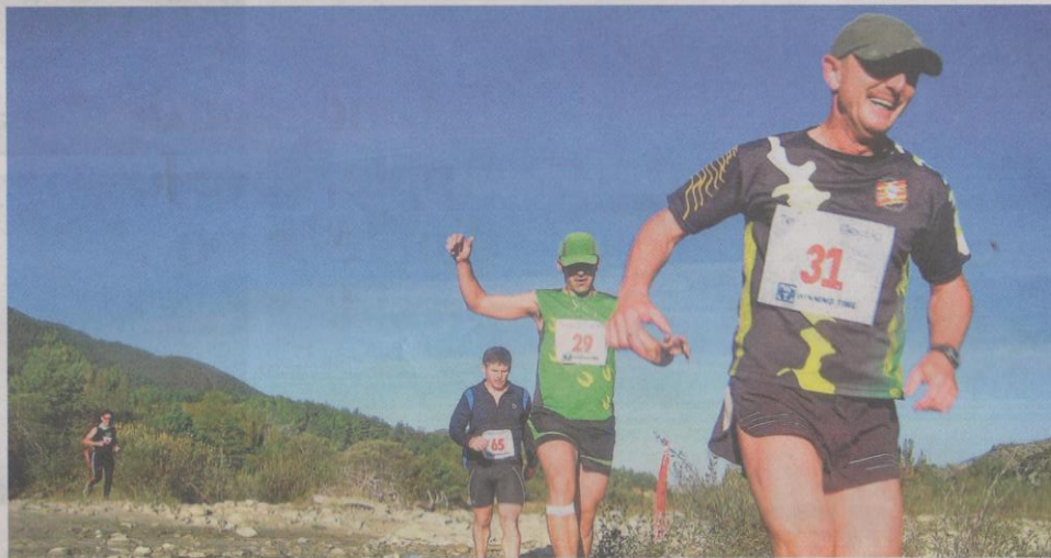
Corredores en pleno esfuerzo en la última edición de la Puyada a Oturia.

Por la Puyada han pasado los mejores corredores del panorama nacional, tanto en los distintos campeonatos que aquí se han celebrado como en los World Series Trials o clasificaciones para la Copa del Mundo en 2009. Las seis citas que ya se han realizado de esta prueba han dejado un sobresaliente curriculum. En la presente VII edición, que se celebrará el próximo día 25 de septiembre, el evento viene a convertirse, por primera vez, en Campeonato de Aragón por clubes de carreras por montaña.