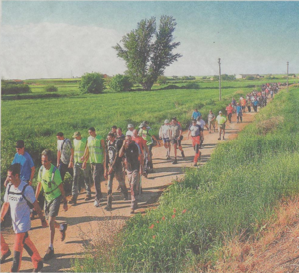
La Gayubada congregó a un buen número de andarines en el entorno de la localidad de Mainar. JOSÉ MARÍA GÁLLEGO

La Federación Aragonesa de Montañismo se encarga de promover un gran número de modalidades deportivas, entre las que se encuentran las grandes andadas populares. Consciente del auge de esta actividad, la FAM decidió crear el Comité de Andadas Populares de Aragón (CAPA), contando con el empuje que darían los voluntarios de Os Andarines d'Aragón y con la incorporación de la Coordinadora de Andadas Populares de Aragón (Coapa) en su estructura, dando cobertura de este modo a todos los colectivos implicados, federados o no, con el objetivo de aunar esfuerzos y coordinar las numerosas organizaciones. Para ello, se creó un calendario común y se editó la 'Credencial del Caminante'. También se iniciaron otras iniciativas que dan a las andadas que se programan un sello unitario y unos mínimos de calidad que redundan en beneficio de los deportistas que, al fin y al cabo, son los verdaderos protagonistas de todas las actividades.